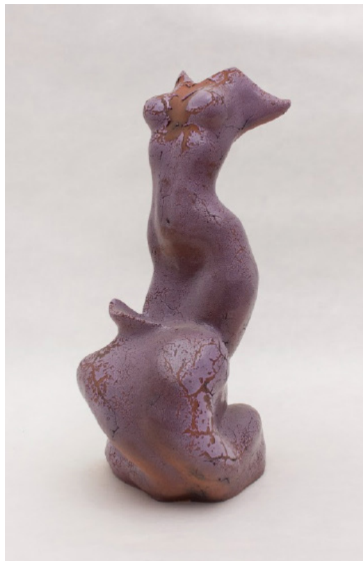
Іл. 2 В. Чернієнко. Обпалені коханням. Стату- етка-підсвічник. Шамот, глазур. 2015 р.