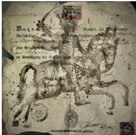
Іл. 2 Папір старий, – життя нове – 2. Еколін, 2021 р.