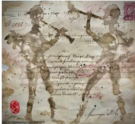
Іл. 1 Старим паперам – нове життя – 3. Еколін, 2021 р.