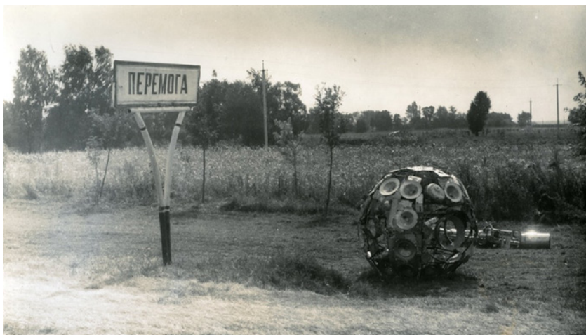
Іл. 4. Федір Тетянич. Біотехносфера. Інсталяція. 1984. Оформлення автобусної зупинки, с. Перемога, Київська область.