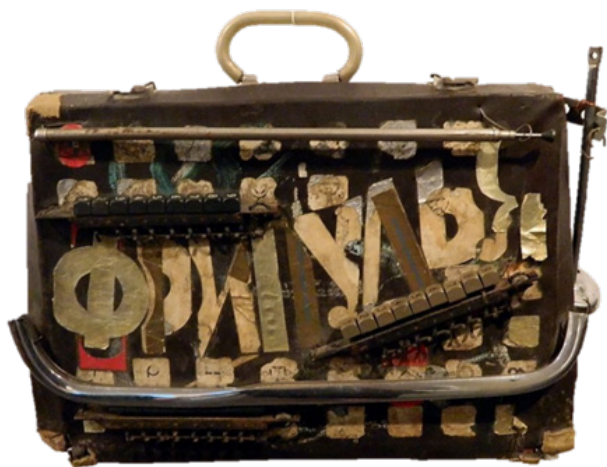
Іл. 2. Федір Тетянич. Чемодан Фрипулі. 1970-ті. Об'єкт.