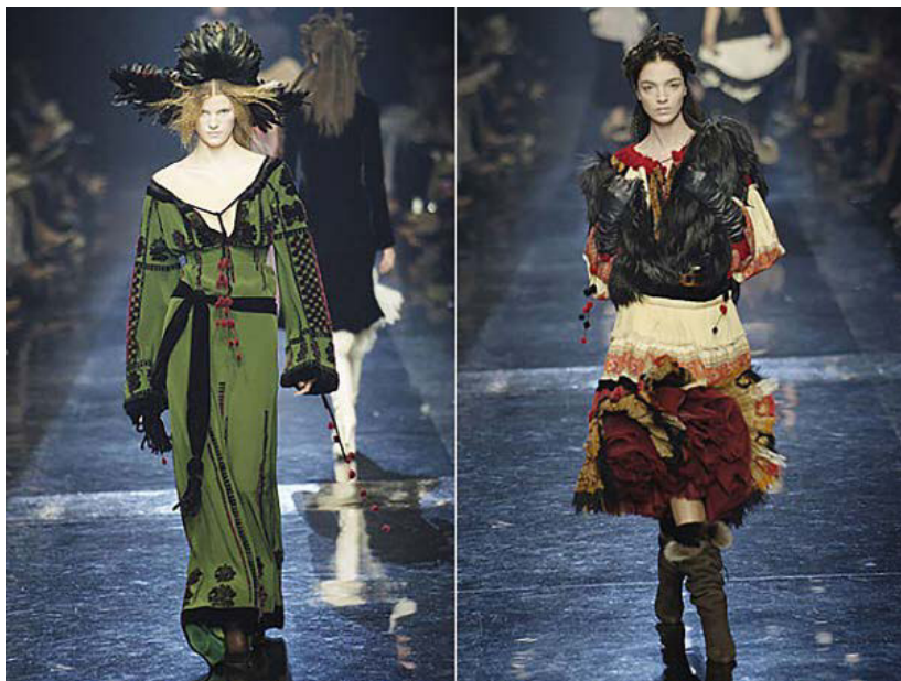
Іл. 1. «Українська колекція» Жана Поля Готьє, Париж, 2005 р.