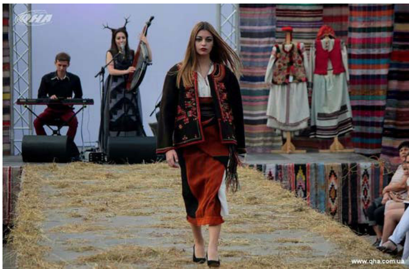
Іл. 3. Демонстрація колекції «Від автентики до сучасного стилізованого одягу», Львів, 2018 р.