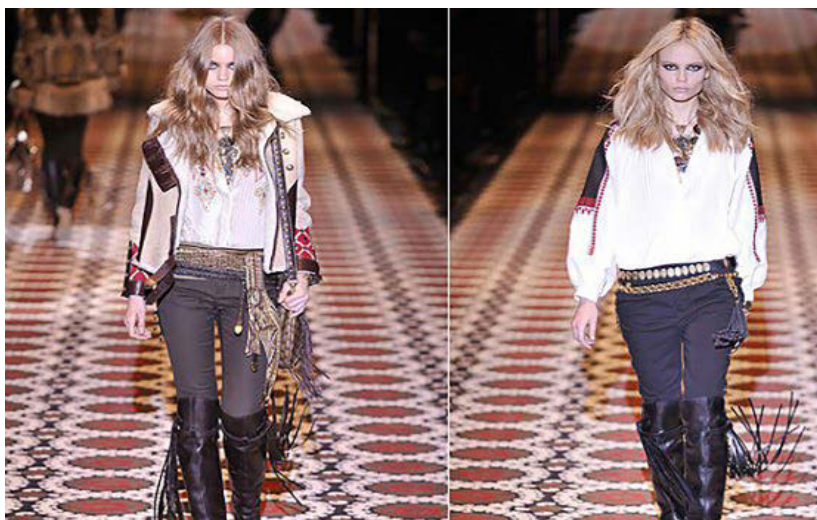
Іл. 2 Колекція з використанням елементів типових національних вишиванок Гуцульщини та Поділля Фріди Джанніні з модельного дому Gucci, Мілан, 2008/2009 рр.