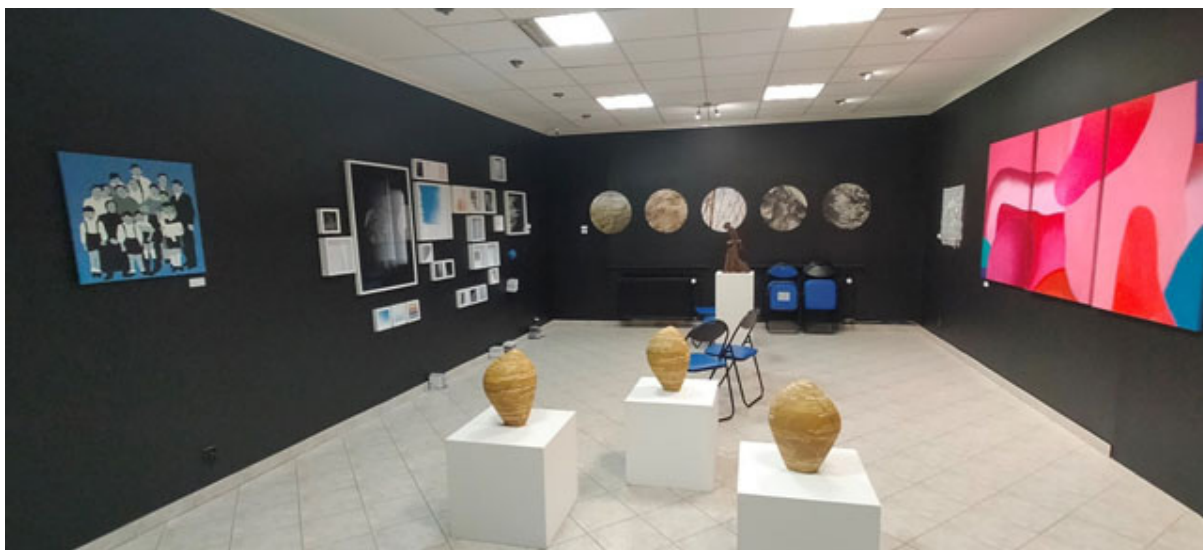
▲ Іл. 5. Експозиція Весняного салону в виставкових просторах Асоціації художників і дизайнерів в Ополе, Польща. 2023 р.