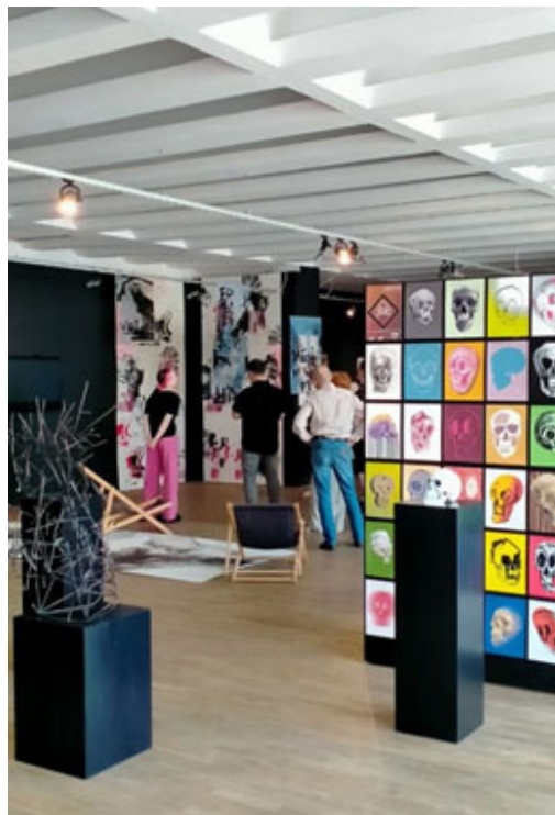
▲ Іл. 4. Експозиція дипломних робіт Відділу мистецтв Опольського університету в Галереї сучасного мистецтва в Ополе. 2023 р.