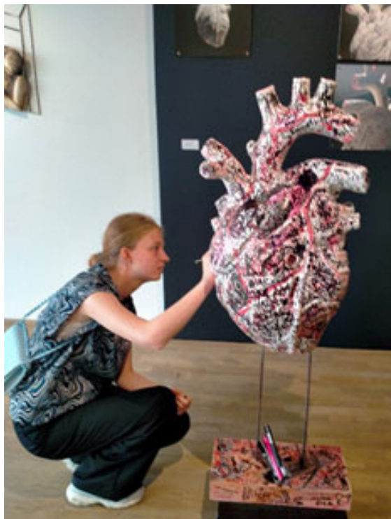
▲ Іл. 3. Інсталяція «Трансформація» Анна Мішцишин на Весняному салоні в Галереї сучасного мистецтва в Ополе, Польща. 2023 р.