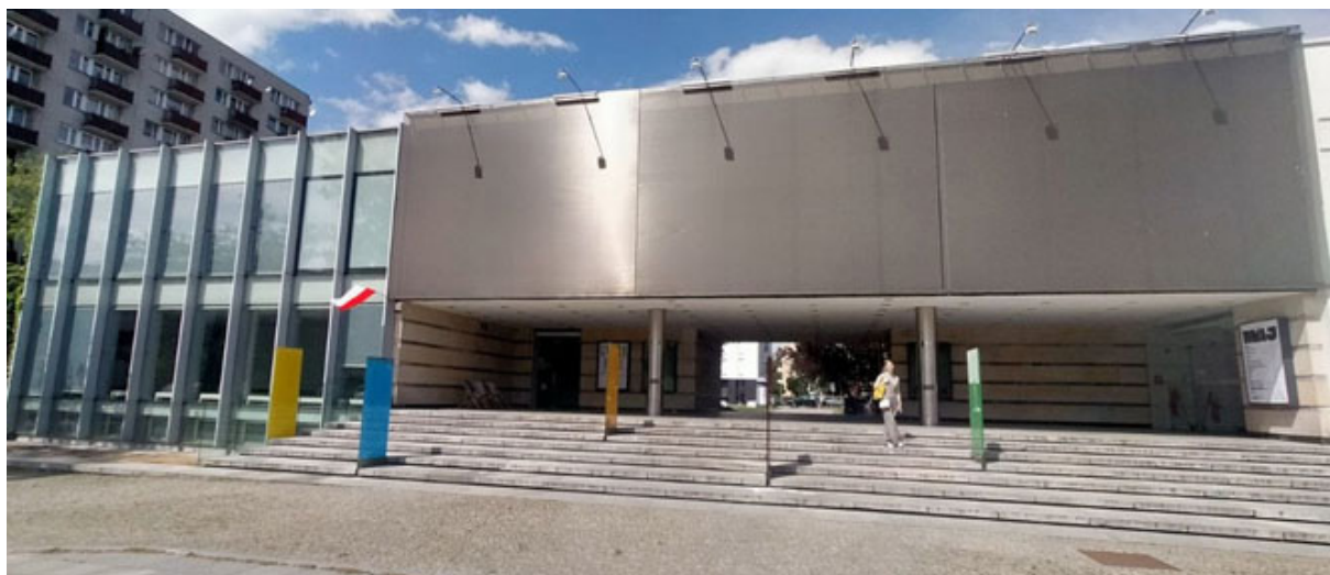
▲ Іл. 1. Галерея Сучасного Мистецтва в Ополе, Польща. Площа Театральна 12. 2024 р.