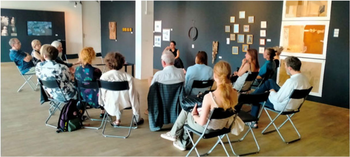
▲ Іл. 6. Зустріч з лауреатами Весняного салону в Галереї сучасного мистецтва в Ополе, Польща. 2023 р.