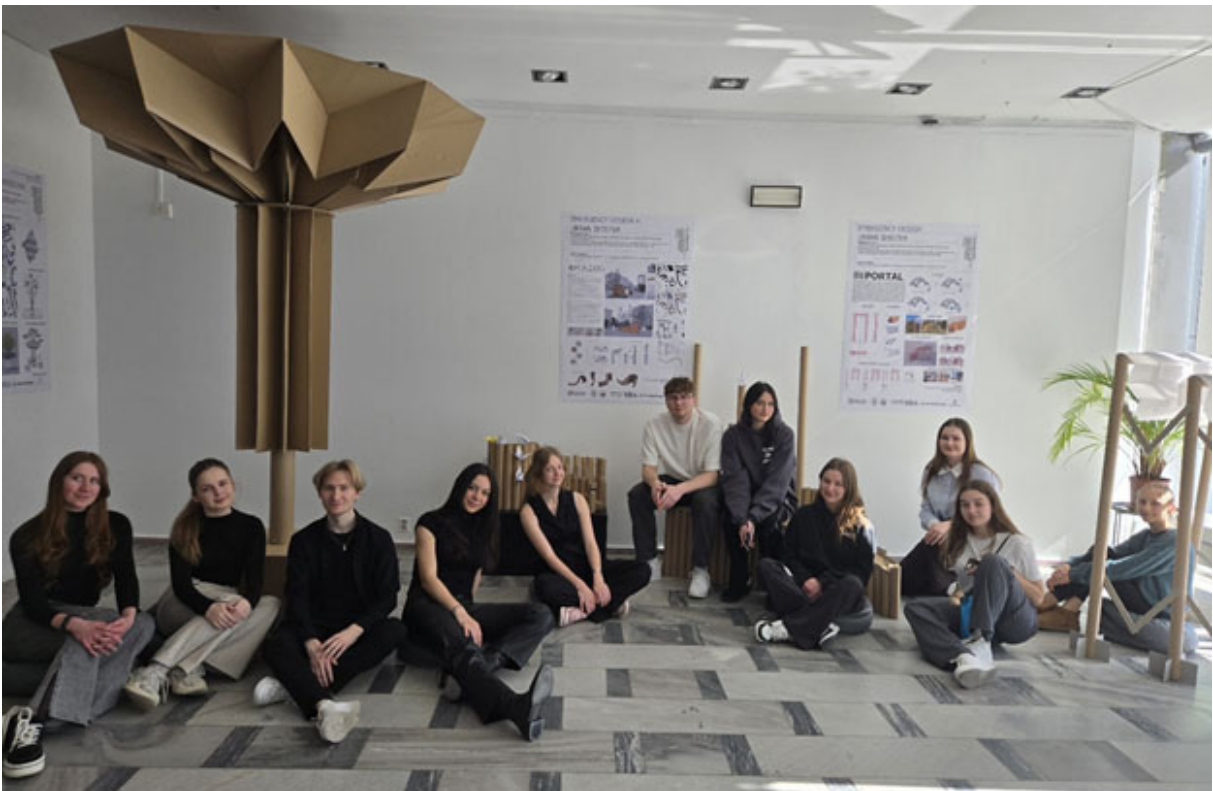
▲ Іл. 7. Воркшоп за участі студентів Опольської політехніки та Національного університету «Львівська політехніка» у Галереї сучасного мистецтва в Ополе, Польща. 2025 р.