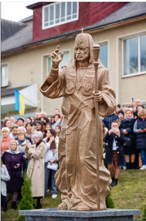
Іл 7. В. Дутка. Пам'ятник Патріарху Володимирі Романюку у с.Хімчин.