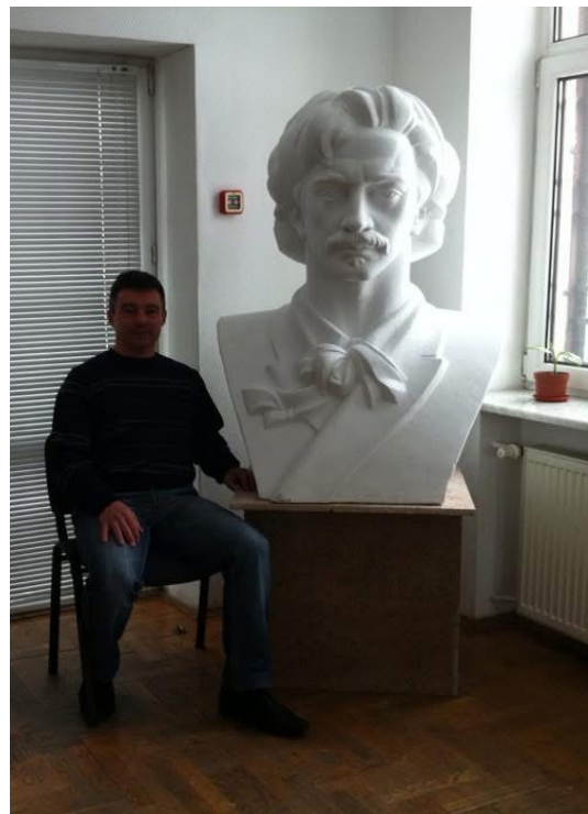
Іл 4. В.Дутка. Погруддя Я.І. Падеревського.